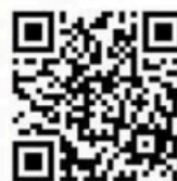
Venta de entradas

Casa de la Cultura de Cullera: Lunes a viernes, de 9h a 20:30h QR de la venta de entradas