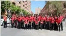
BANDA DE CC I TT TRES FORQUES GAR VALENCIA