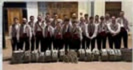
BANDA DE CC I TT FALLA MERCAT ALCAISSER