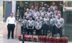
BANDA DE CC I TT S.C.U.D.A.M.M. (CULLERA)