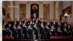
BANDA DE CC I TT NTRA. SENORA DEL REDENTOR LA COMA - PATERNA