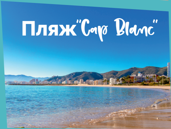
Пляж "Cap Blanc"