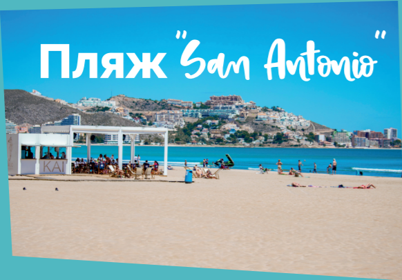
Пляж "San Antonio"