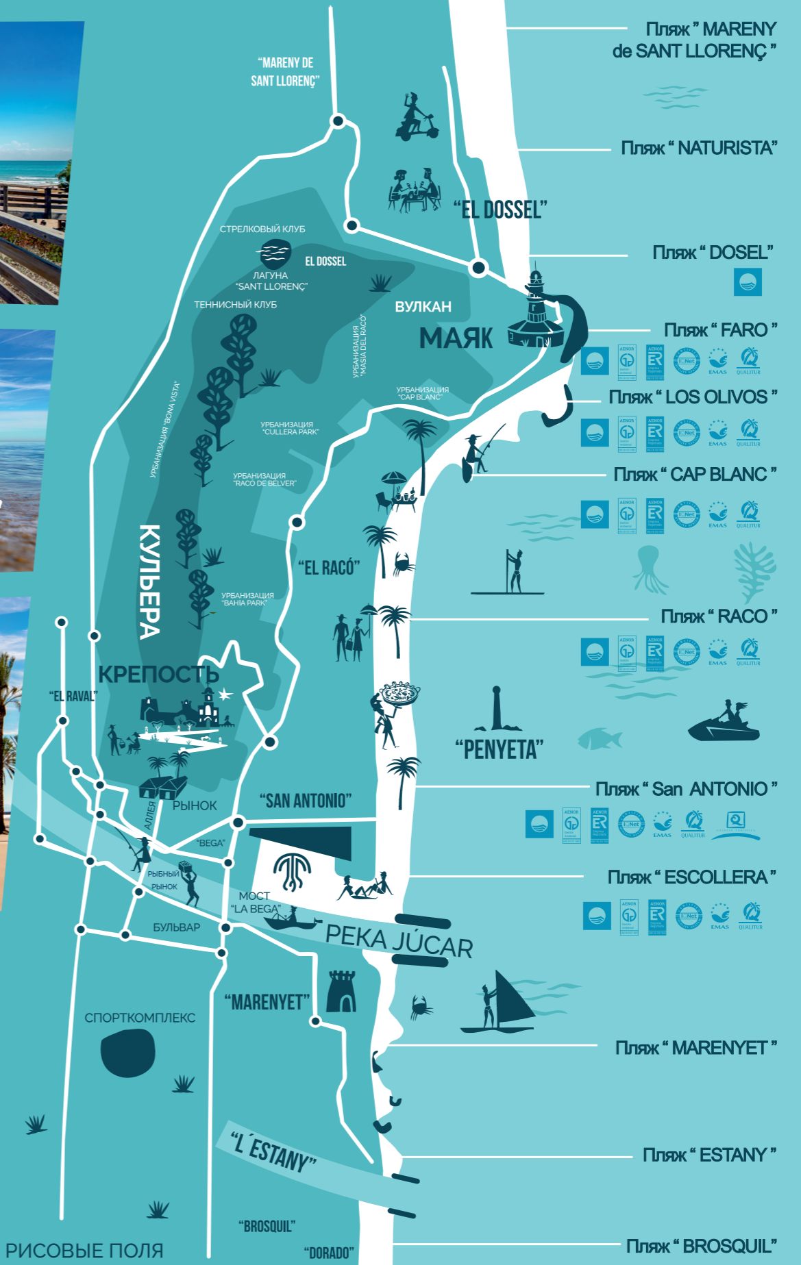
Пляж "MARENY de SANT LLORENÇ"