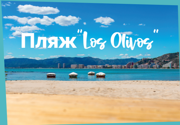
Пляж "Los Olivos"